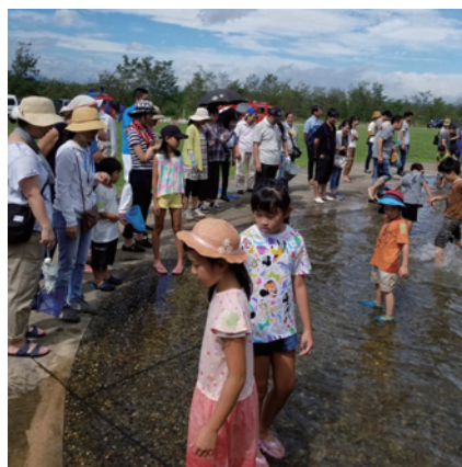
マスのつかみ取り