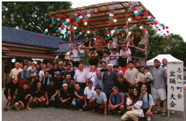
4年ぶりの盆踊り大会に役員も大忙し

今年も、当町会にとって30数年続いております最大行事の「どんと焼き」を執り行うことができました。 どんと焼きは、ふたけた会を中心に前年の12月より準備を進め、成人式の日に今年一年の無病息災を願って執り行っております。当日は大勢の町会員をはじめ、近隣の人々が集い賑わいを見せ盛会に行われました。 また、7月には4年ぶりに「盆踊り」を執り行うことができ、ふたけた会が焼きそばや焼き鳥、子供達にヨーヨーなどの屋台を出店し、集まった多くの町会員が久々の行事に楽しいひとときを過ごすことができました。