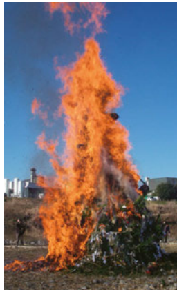
無病息災を願う最大行事「どんと焼き」