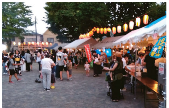
模擬店でにぎわう盆踊り大会の会場

翌週は祭礼で早朝から浅草や近隣からの応援の担ぎ手が集まります。疫病退散、家内安全を願う町内を渡御、山車巡行。本祭りは福生駅東口西友前で5町会の山車、神輿の競演が催されます。多くの観客が見守る中で演者の死に物狂いの演技は圧巻。 (4頁につづく)