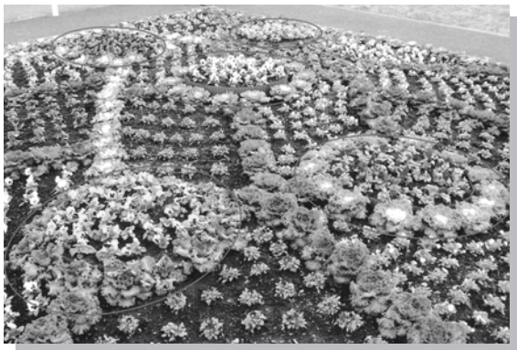
花いっぱいコンテスト

年度「花いっぱいコンテスト」で春・秋とも最優秀賞をいただきました。この事業も、町会内の各団体が、腐葉土作りから植え付けまで、子供からお年寄りまで一緒に創りあげています。