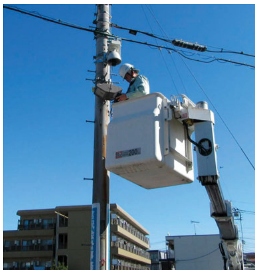
防犯カメラ設置の様子（福東町会）

いのであればせめて防犯カメラだけでも設置して欲しいとの要望も多くありましたので、これは千載一遇のチャンスだと思い、駅の近くと遊歩道入口の2か所に防犯カメラの設置を申請しました。申請から約1年で防犯カメラ2台が設置され、設置費用負担額は、東京都と福生市の補助のおかげで総額の12分の1で済みました。 カメラ設置後、警察署から事件や事故の調査のため映像データ抽出要請があったり、防犯カメラが設置されていることが周知されることによって犯罪等の抑止力になっていると思います。 防犯カメラが安全で安心して生活できる地域づくりの一助になれば幸いです。